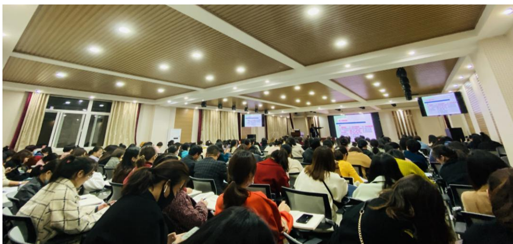
学霸中的学神:积极互动中的学员